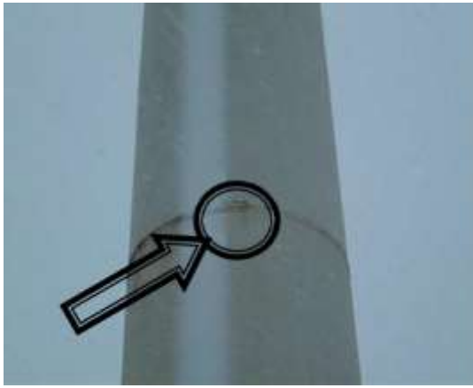
Crack in the weld of the tower