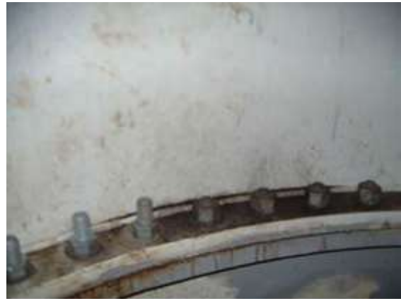
Crack in the weld of the flange to the tower